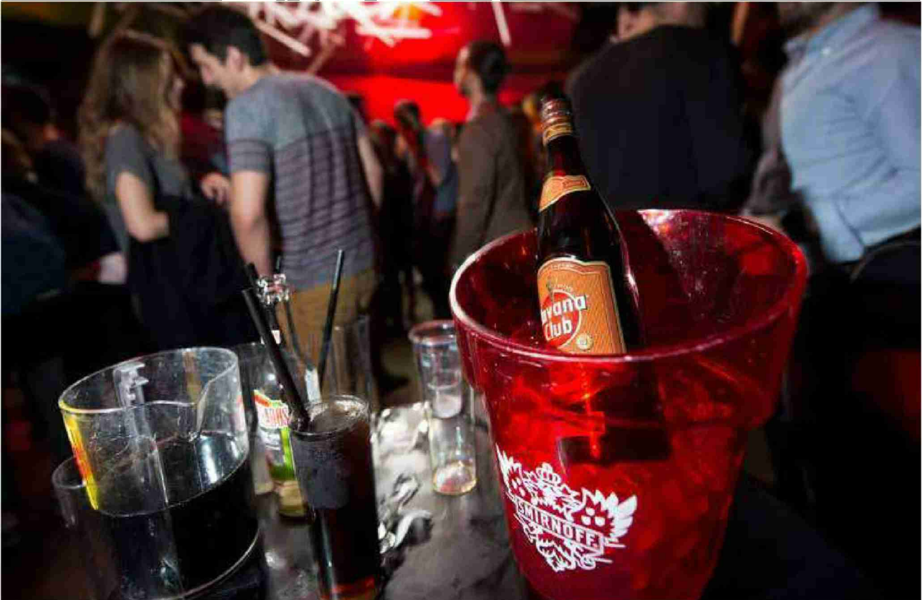
Les happy hours ne peuvent avoir lieu qu'entre 17 h et minuit et durant une heure seulement.